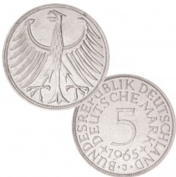
Silberadler BRD 5 DM - "Heiermann"

Je deutscher Prägestätte ein anderer Blauton: BRD 5 Euro 2016 „Planet Erde“ Polierte Platte, ADFGJ, Weltpremiere Münze mit Polymerring