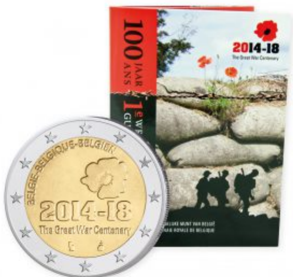
Belgien 2 Euro-Gedenkmünze 2014 "I. Weltkrieg"