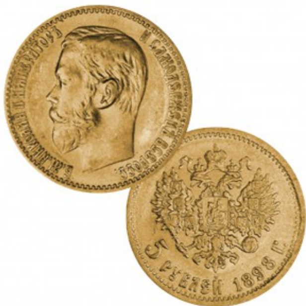
Russland, 5 Rubel 1898 (Regent Nikolaus II.), 900er

Die drei baltischen Republiken Litauen, Estland und Lettland feiern mit der ersten baltischen 2 Euro-Gemeinschaftsausgabe den 100. Jahrestag ihrer Unabhängigkeit. Estland gibt zudem eine eigenständige 2 Euro-Gedenkmünze 2018 heraus.