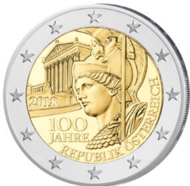
Österreich 2 Euro-Gedenkmünze 2018 „100 Jahre